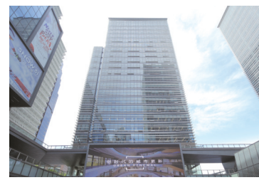
浦东金融广场T3塔楼