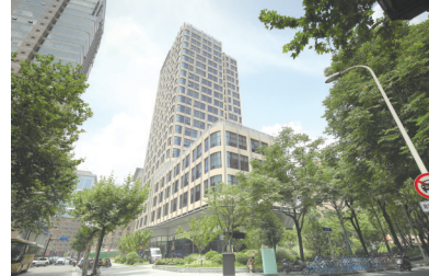
国泰君安办公楼新建项目