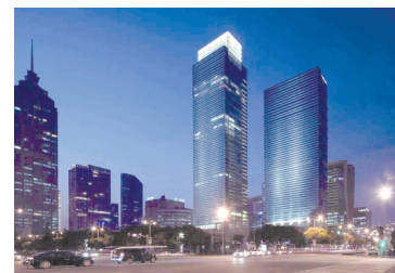
苏州国际财富广场