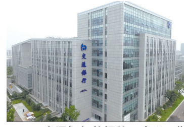
交通银行数据处理中心三期