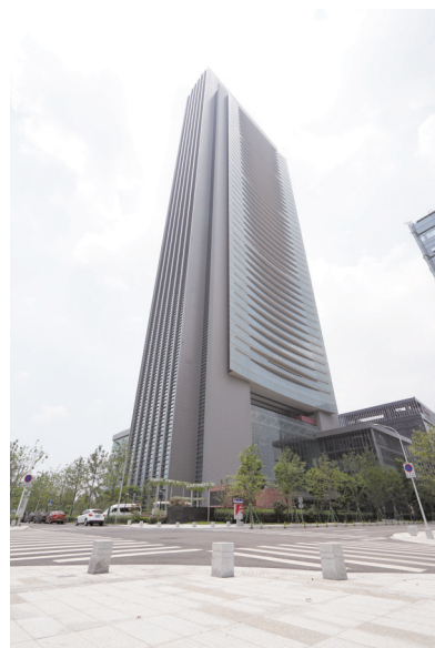
宁波环球航运广场

上海建工一建集团成立66年以来,共创建国家优质工程鲁班奖30项,包括:上海北外滩白玉兰广场办公塔楼、中山医院门急诊医疗综合楼、瑞金医院门急诊医技楼改扩建、太平金融大厦等项目;创建国家优质工程奖(银奖)16项,包括:中国人寿数据中心、宁波环球航运广场、苏州月亮湾B-05地块等项目;创建上海市优质工程“白玉兰”奖223项。