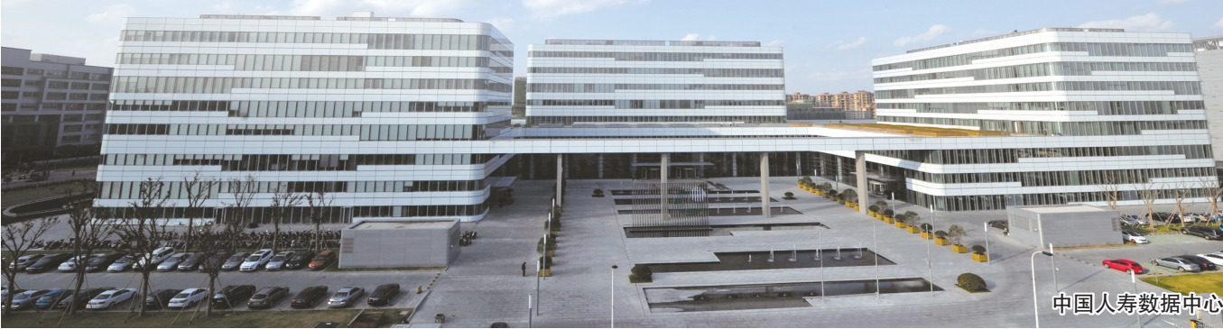
中国人寿数据中心