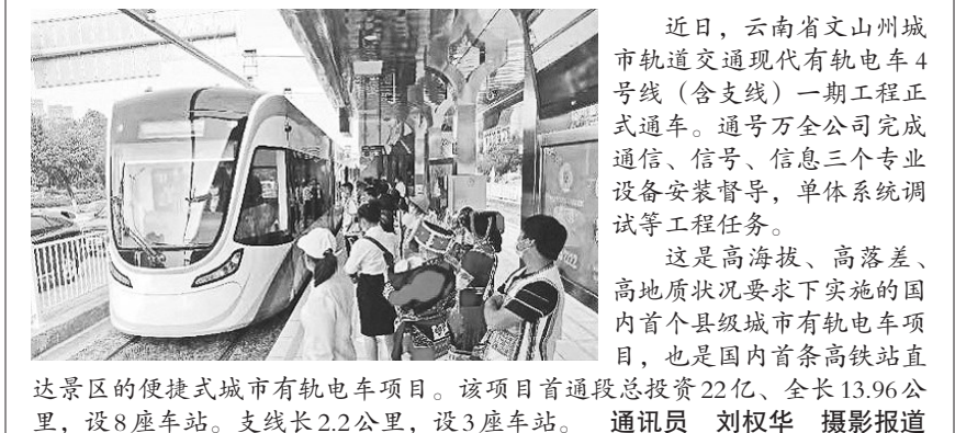
近日，云南省文山州城市轨道交通现代有轨电车4号线(含支线)一期工程正式通车。通号万全公司完成通信、信号、信息三个专业设备安装督导，单体系统调试等工程任务。这是高海拔、高落差、高地质状况要求下实施的国内首个县级城市轨道交通项目，也是国内首条高铁站直达景区的便捷式城市轨道交通项目。该项目首通段总投资22亿，全长13.96公里，设8座车站。支线长2.2公里，设3座车站。