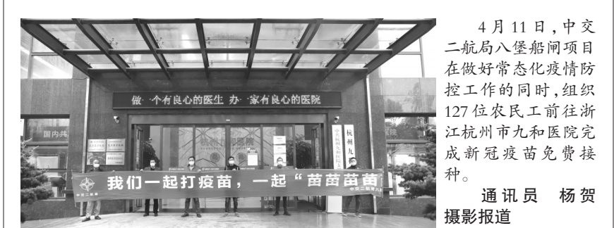
4月11日，中文二航局八堡船闸项目在做好常态化疫情防控工作的同时，组织127位农民工前往浙江杭州市九和医院完成新冠疫苗免费接种。