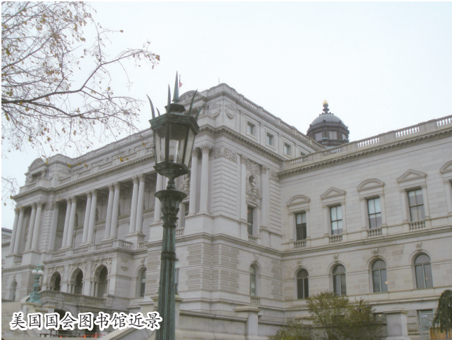
美国国会图书馆近景

但是,在这个世界图书馆最权威的美国国会图书馆,却也有令人难以置信的现实:据中国学者余秋雨自己披露,2005年初他受邀到美国国会图书馆去演讲时,图书馆的负责人为了表示对他的热烈欢迎,特意取出了一大堆馆藏的余秋雨著作来给听众做介绍。不料,余秋雨却发现这些书中至少有一半的书虽然封面上都署名是余秋雨,但是书名却是他这个“作者”从来不知道的。原来,美国国会图书馆采购和收藏的余秋雨著作,竟然有一半是盗版书和伪书。这真是有点黑色幽默的味道了。