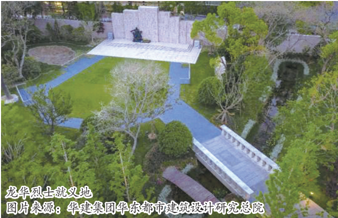
龙华烈士就义地 图片来源:华建集团华东都市建筑设计研究总院

华建集团在数十年的发展过程中,承接了众多红色建筑项目的设计任务,成就不少经典力作。今年适逢中国共产党建党100周年,5月28日,华建集团特邀曾设计过一些红色建筑的建筑师,带领媒体团队故地重游,阅读位于上海的部分红色建筑,分享设计理念,传承初心使命。随行之间,众人在铭记难忘的革命历史之际,又为红色建筑设计巧思啧啧惊叹。