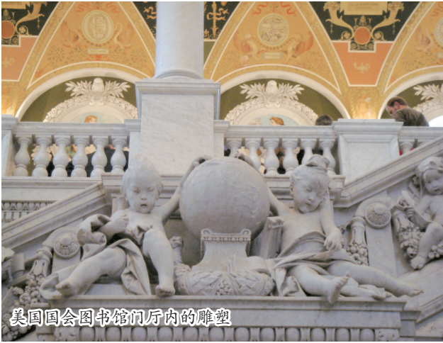
美国国会图书馆门厅内的雕塑