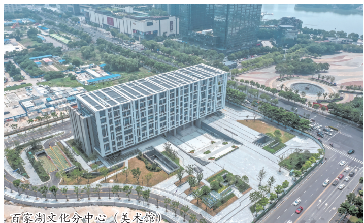
百家湖文化分中心(美术馆)

项目总建筑面积 30508.24 平方米, 地上层数 5 层, 地下 2 层, 开放与容纳是其基本的功能要求, 汇集江宁区人口逾百万。这座在建设伊始就备受期待的“文化