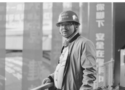
为施工单位和当地政府和百姓正常生产和生活带来了一些影响。而多数项目自带运输队伍清运弃渣，又挤占了当地运输企业或运输个体户。这个问题不处理好，清运弃渣期间难免会经常发生各种矛盾和冲突，盾构施工必然受到影响。

按照设计图例划定的盾构弃渣堆放场地，中铁十一局城轨公司项目部清运弃渣要经过长沙高新区、天心区、雨花区和跨越湘江，运距远一方面，还有清运弃渣期间随时需要打扫道路卫生，都是他们不得不面对的大问题。