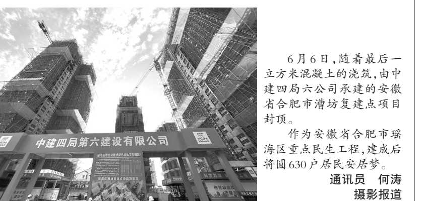
6月6日,随着最后一立方米混凝土的浇筑,由中建四局六公司承建的安徽省合肥市潜湾复建点项目封顶。作为安徽省合肥市瑶海区重点民生工程,建成后将为630户居民安居。

在前期试点的基础上,两部门将进一步开展联合监管行动,促进保障农民工工资支付制度全覆盖。北京市人力资源社会保障局有关负责人说,《备忘录》的实施,将有利于农民工工资报酬权益的维护。通过远程监管、非现场检查等方式,进一步减少对企业的现场检查频次,减轻企业接受现场检查的负担,对守法诚信的企业做到“无事不扰”,对违法违规问题精准施策、靶向治疗。(杜燕)