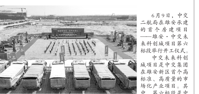
6月9日,中交二航局在雄安新区承建的首个房建项目——雄安·中交未来科创城项目第六标段举行开工仪式。中交未来科创城项目是中交集团在雄安新区首个高标准、高质量的市场化产业项目。其中,第六标段是中交二航局在雄安新区中标的首个房建工程,总建筑面积约16.13万平方米。主要建设内容包括商务办公楼、商业楼、住宅楼等。通讯员 李安辉 吴宙 张蕾蕾 邵世有 摄影报道