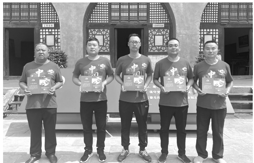
中煤建安公司六十九处陕西榆林大海则项目部党支部组织党员赴神泉堡革命纪念馆开展现场“体验式”集体政治生日活动。党员们通过参观神泉堡革命纪念馆文物文献,追忆老一辈革命家的革命斗争岁月,进一步增强自身荣誉感、责任感,激发党员先锋模范作用。

中铁上海局郑济高铁项目部参与了郑济铁路(山东段)站前工程施工ZJTLZQSG-1标长清黄河特大桥工程建设。工程正线长度33公里,有11座连续梁。