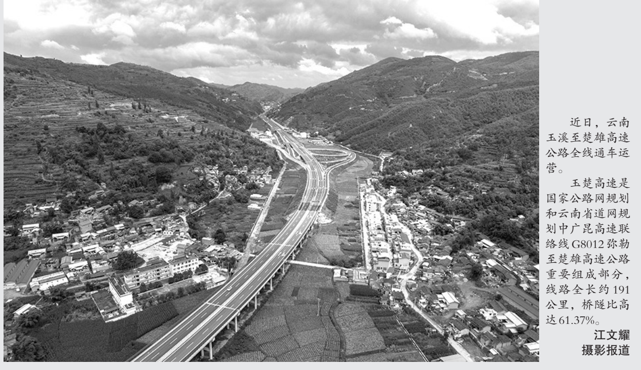
近日,云南玉溪至楚雄高速公路全线通车运营。玉楚高速是国家公路网规划和云南省道网规划中广昆高速联络线G8012弥勒至楚雄高速公路重要组成部分,线路全长约191公里,桥隧比高达61.37%。