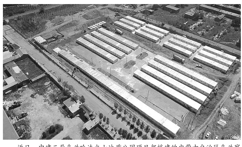
近日,中建二局乌兰哈达火山地质公园项目部援建的内蒙古自治区乌兰察布市察哈尔右翼后旗方舱隔离点达到交付使用条件。隔离点规划占地面积30000平方米,设500间隔离间,用于安置新冠肺炎密切接触者及次密切接触者等。每个隔离房面积18平方米,卫浴水电俱全,配备桌椅、热水器等。