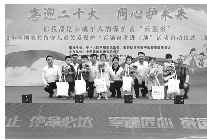
喜迎二十大 同心护未来 你我都是未成年人的保护者“云签名” 2022年全国农村留守儿童关爱保护“百场宣讲进工地”活动启动仪式(第32场) 指导单位:中华人民共和国民政部、国务院国有资产监督管理委员会 主办单位:中国建筑集团有限公司、中国建设银行股份有限公司、中国工商银行股份有限公司、中国农业银行股份有限公司、中国农村信用合作联社

活动现场以视频形式回顾了近五年来中建八局留守儿童关爱工作的开展情况,并开展了工友代表宣读“我是法定监护人”承诺书、宣讲志愿者代表宣读亲子共读倡议书、儿童保护(安全自护)专题宣讲等活动。