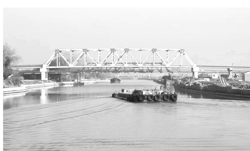
中铁四局二公司常州溧阳航道项目经理部在积极创建安全标准化工地过程中,认真推行工地安全网格化和安全标准化积分管理制度,有效地促进了参建员工管理现场的自觉性,工程开工以来,安全工作始终受控,被江苏省评为省级平安工程示范工地。图为该项目部施工的后马垫桥。