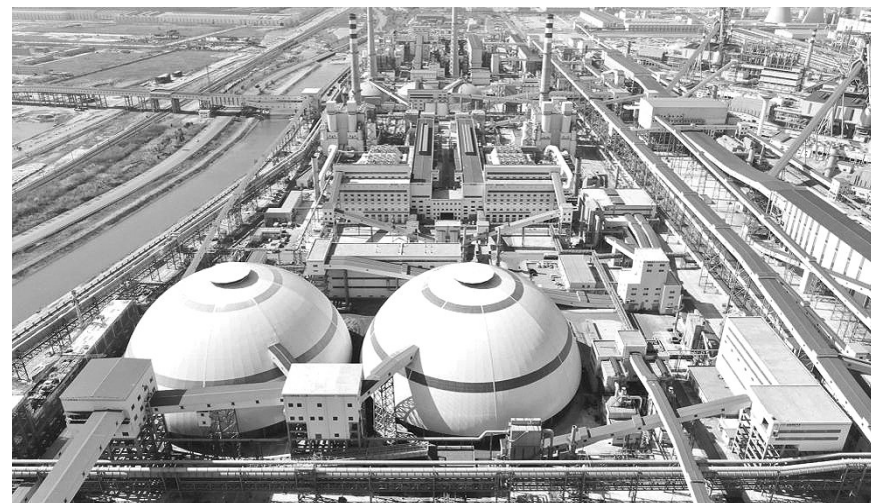
目顺利开工建设，标志着河北省安装工程公司“走出去”的步伐越走越快，也对公司加快拓展海外市场步伐起到重要意义。 (通讯员 刘帆)

心打下良好基础，更是为公司在星级酒店装饰装修工程业绩蓝图上增添浓墨重彩的一笔。 河北建工省安装公司一季度又创新高业绩。该公司2023年第一季度在建项目420个，其中亿元以上项目达到71个，省外项目占比超80%，该公司先进生产技术得到国内安装工程行业的认可，尤其是公司施工总承包的河钢产业升级及宣钢产能转移项目荣获2022-2023年度第一批国家优质工程奖金奖工程，这是该公司成立以来首次获得国家优质工程金奖这一殊荣。 在国家“一带一路”倡导下，该公司新签订的阿尔及利亚250万吨二期DRI还原铁项目是继2018年阿尔及利亚还原铁一期项目后又一个重大突破，合同额达5000余万元。共建“一带一路”，共享发展繁荣，该公司多个海外项