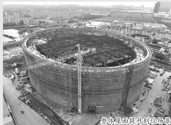
整体屋面提升到位场景