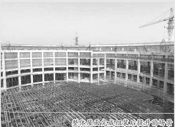
整体屋面完成组架后提升前场景