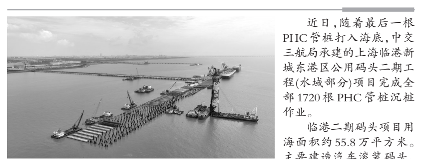
近日，随着最后一根PHC管桩打入海底，中交三航局承建的上海临港新城东港区公用码头二期工程(水域部分)项目完成全部1720根PHC管桩沉桩作业。