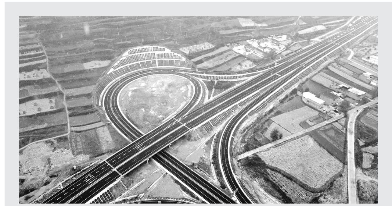
11月12日，临大高速公路项目正式通车运营。临大高速公路路线全长52.505公里。该高速公路是甘肃省高速公路网规划的省级高速公路18条联络线中的一条，是G6京藏高速公路和G1816乌玛高速公路的连接线。临大高速公路共建设桥梁24座，全长10492米；隧道13座，全长21555米。桥隧比例达到了61%。