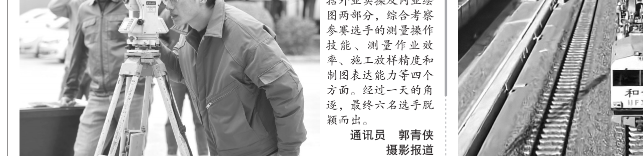
近日，中煤三建二十九工程处举办2023年度工程测绘技能大赛。大赛包括外业实操及内业绘图两部分，综合考察参赛选手的测量操作技能、测量作业效率、施工放样精度和制图表达能力等四个方面。经过一天的角逐，最终六名选手脱颖而出。

灾后重建项目库建成运转。“围绕‘一年基本恢复、三年全面提升、长远高质量发展’总体思路，本市坚持以规划引领项目、以项目支撑规划，规划编制与项目组织同步进行，有