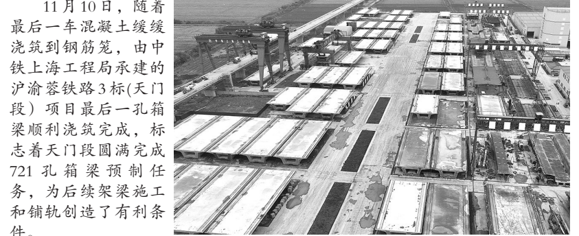
11月10日，随着最后一车混凝土浇筑到钢筋笼，由中铁上海工程局承建的沪渝蓉铁路3标(天门段)项目最后一孔箱梁顺利浇筑完成，标志着天门段圆满完成721孔箱梁预制任务，为后续架梁施工和铺轨创造了有利条件。