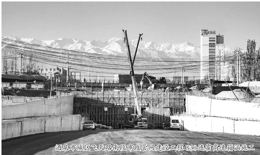
酒泉市瓜州县飞天路南段市政管网建设工程G30道管沟管沟施工

生态公司聚焦“一核三带”“四强”行动，建设黄河上游生态功能带等重大战略部署，抢抓“三北”六期工程建设机遇，主动与省市州林草、环保、自然资源等重要厅局加强对接，加强与当地政府、企业在项目运作、科技研发、技术创新等方面的深入合作。在国家政策、资金扶持的领域，充分利用政策、人脉等资源，加大项目跟踪力度，主动谋划项目、创造项目，积极谋划对接。近年来，一批事关地区长远发展和民生福祉的项目建设有序推进，书写了助力县域经济高质量发展的时代画卷。积极