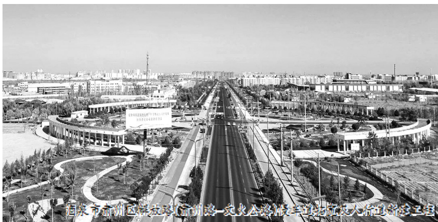
兰州市西固区红古路市政管网工程一期施工

生态公司始终坚持效益优先、创新驱动、产业升级和服务大局理念，积极探索“政企、银企、企企”合作新模式。强化目标引领，持续深耕县域市场，坚持抓投资、上项目、促发展，全力以赴做好省内市场增量、扎根县域经济发展，主动加强与省直政府部门、林业保护中心、地方政府、地方环保、林草等部门对接，及时、精准、动态跟进国家和省委有关生态环保、林草领域的政策信息，利用各种资源，精准对接项目，全力以赴储备更多优质项目。加大与成熟的央企、银行、民企以及相关社会资源合作，积极搭建合作平台、拓展合作空间、创新合作机制，用信誉和品质获取合作方的信赖。持续加强与金融机构沟通合作，在产业基金、保险等方