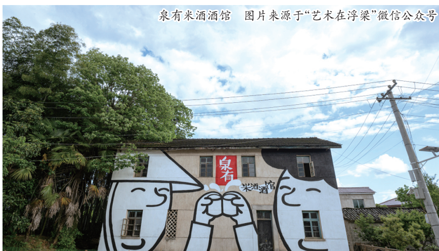
泉有米酒酒店

法。于他而言，漫画就是向大家展示生活中有意思的片段，他不断尝试将漫画融入不同场景，或者与建筑空间发生对话，让人换一个视角看世界，从焦虑中短暂抽离。