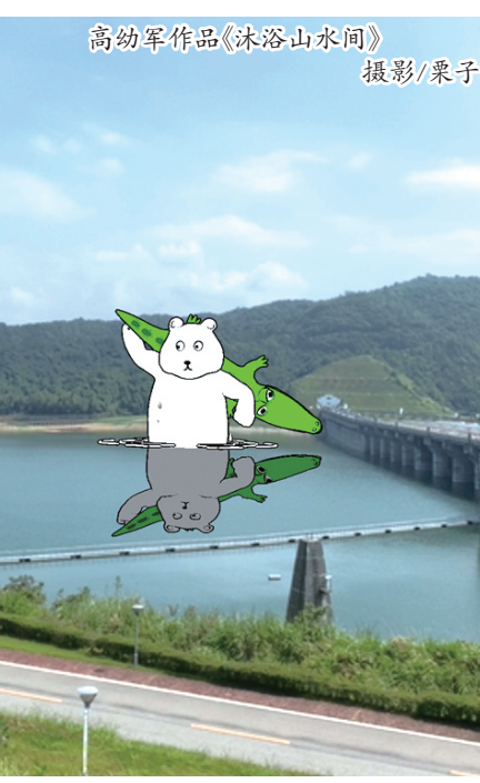
高幼军作品《沐浴山间》

“在一众艺术家眼中，我算不上主流。”他谦虚地说，“其实作品不被过度关注才是最好的状态，但是你又真