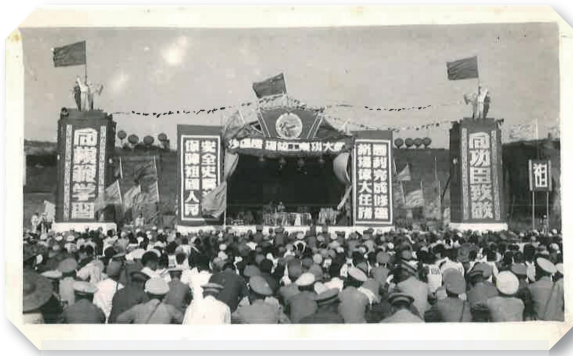
1955年 建七师从武汉整建制转业至西安

在祖国广袤的大地上,有这样一支建设劲旅。70年来,他们从核武器研制基地的钢筋铁骨到现代专业建造管理服务商,用钢枪守护和平,用铁镐建设家园,在强国梦想的征程中书写了一部“战斗英雄、建设模范”的壮丽史诗。陕建十一建集团,这支由部队转业而来的建筑铁军,始终与国家同呼吸、与时代共奋进,以不变初心和极致匠心铸就了一座座时代丰碑。