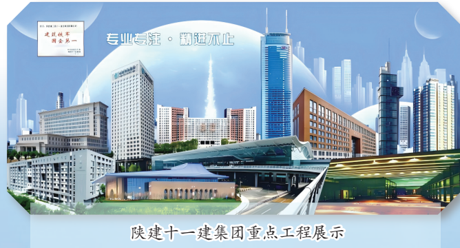
陕建十一建集团重点工程展示

团逐渐走出大西北,将业务拓展到更广阔的领域,走向全国,走向国门,在国际舞台上展现中国建筑企业的实力和风采。